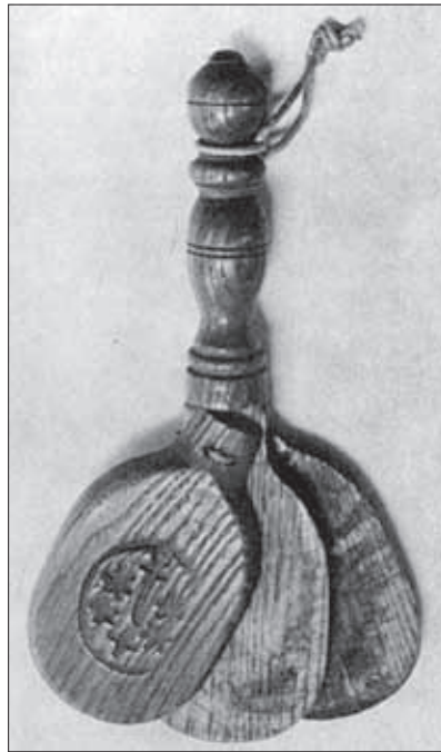
'De clep der leprozen' ook wel klikspaan genoemd. Een geïnfecteerde die zich op straat vertoonde moest deze in de hand houden en daarmee voortdurend een waarschuwend geluid geven.

Ook op zindelijkheid werd scherp toegezien. In elk besmet huis moesten goede, vrome en getrouwe burgers aanwezig zijn, die met het schoonhouden en schrobben waren belast. Met zorg was bepaald op welke wijze huisvuil, gebruikt