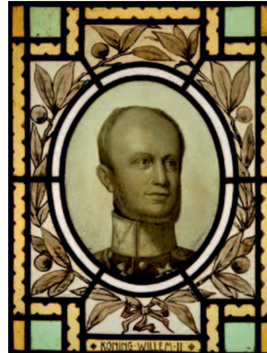
Anoniem glas in lood, waarop een portret van Koning Willem II is afgebeeld in een ovaal medaillon. Het werd vervaardigd in 1908. (Collectie Museum Helmond)

het staatshoofd door burgemeester Frans Timmermans ceremonieel welkom geheten, waarna een feestelijke intocht door de versierde straten startte. De geestdrift van de bevolking was groot. Men wuifde en juichte en de lucht weergalmde met 'Leve de koning' en uitbundig klokkengelui.