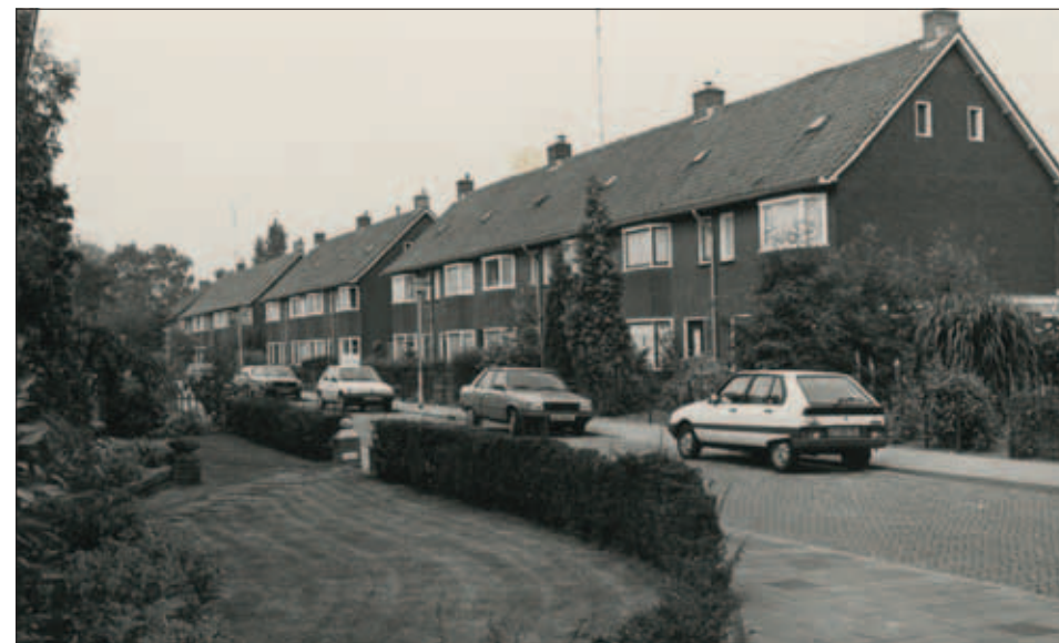
Kloosterweide gezien in de richting van de Haaglaan.

Tegenwoordig herinnert alleen deze naam nog aan de historie van dit gebied. Boven de grond is daar verder niets meer van terug te vinden. Maar onder de oppervlakte des te meer, want bij graafwerkzaamheden zijn enkele malen overblijfselen aan het licht gekomen. Zo werden omstreeks 1850 op deze locatie menselijke skeletresten teruggevonden, die vrijwel zeker hebben toebehoord aan het parochiekerkhof. En bij rioolwerkzaamheden aan de Eikendreef in 1986 werd door de Archeologische Vereniging Helmond een noodopgraving verricht. Hierbij kwam een fundering aan het licht uit de tweede helft van de vijftiende eeuw, die vermoedelijk heeft toebehoord aan het kerkgebouw of aan het Augustinessenklooster.