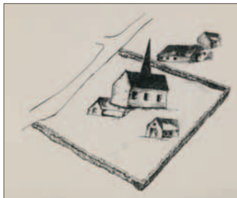
Impressie van het klooster in die Haghe naar een kaart van Jacob van Deventer.

Deel van het minuutplan sectie A, tweede deel uit 1834. Hierop is de kruising Eikendreef / Mierloseweg te zien met, bij de pijl, de wei (nr 454) waar ooit de parochiekerk en het klooster stonden.